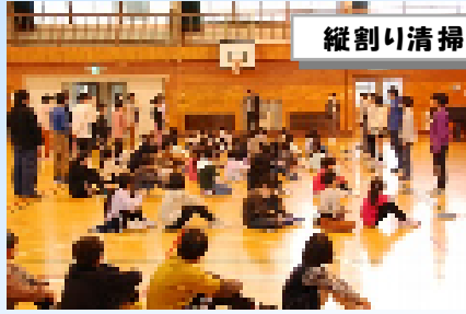
縦割り清掃班顔合わせ