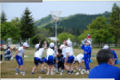
1・2年 おどって☆ポンポン