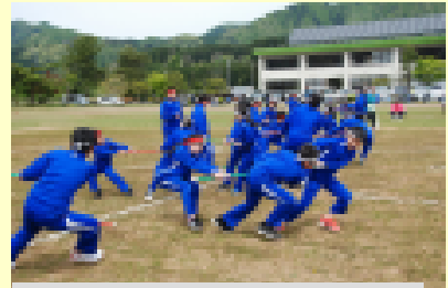
5・6年 ひっばれ！ひっばれ！