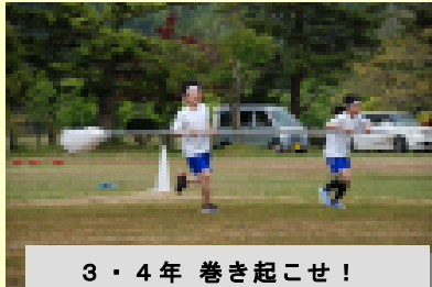
3・4年 巻き起こせ！ 成章タイフーン